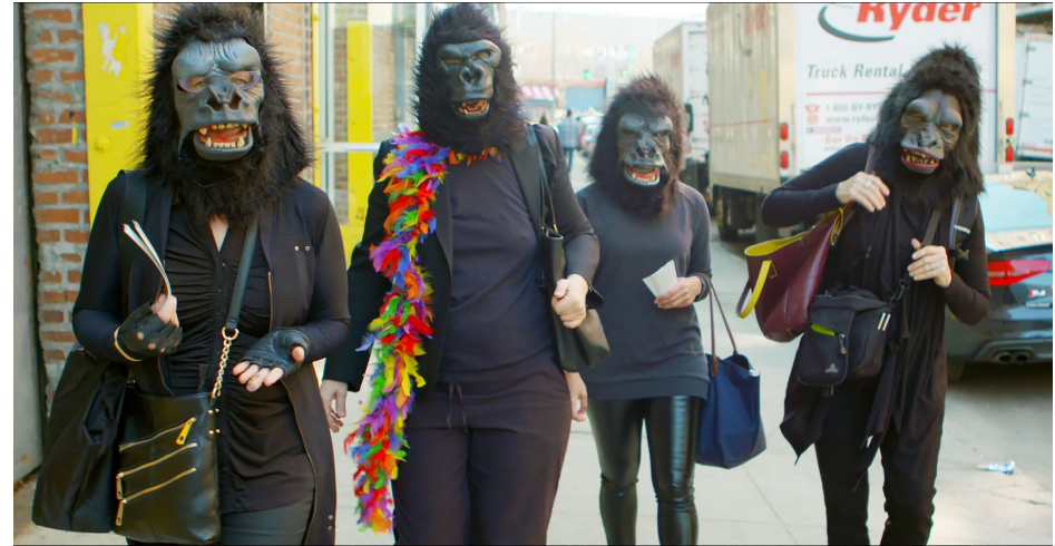
De Guerrilla Girls, 1981